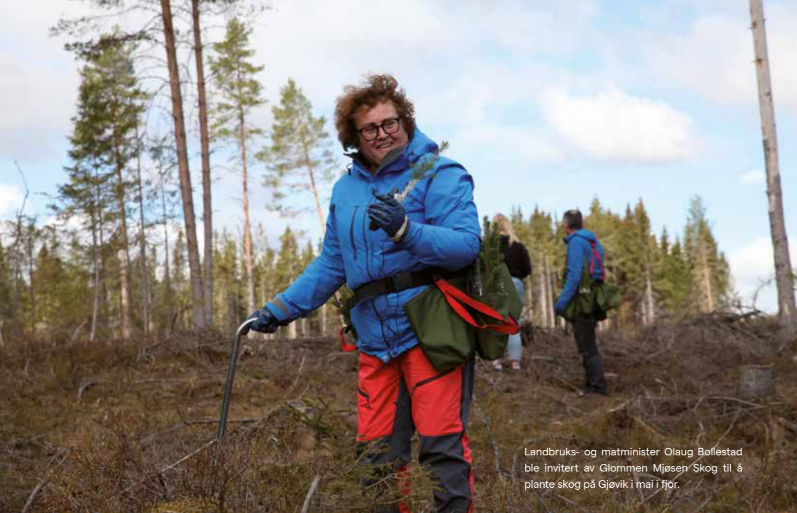
Landbruks- og matminister Olaug Bollestad ble invitert av Glommen Mjøsen Skog til å plante skog på Gjøvik i mai i fjor.